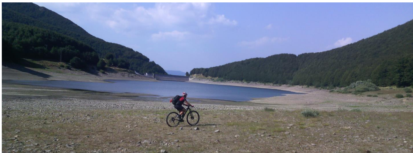
Lago del Lagastrello

Pedalare sull'acqua: viaggio alle sorgenti dell'Enza.